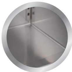
zaoblené vnitřní kouty rounded corners