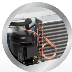
vyjímatelná kompaktní chladicí jednotka removable compact refrigerating unit