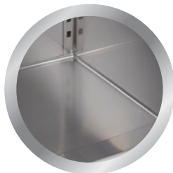
zaoblené vnitřní kouty rounded corners