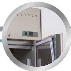
vyměnitelné těsnění dveří replaceable door gasket