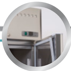
vyměnitelné těsnění dveří replaceable door gasket