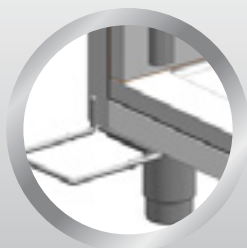
nožní pedál foot pedal