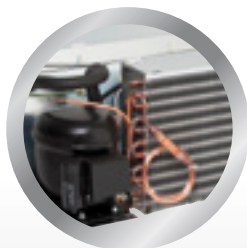
vyjímatelná kompaktní chladicí jednotka removable compact refrigerating unit